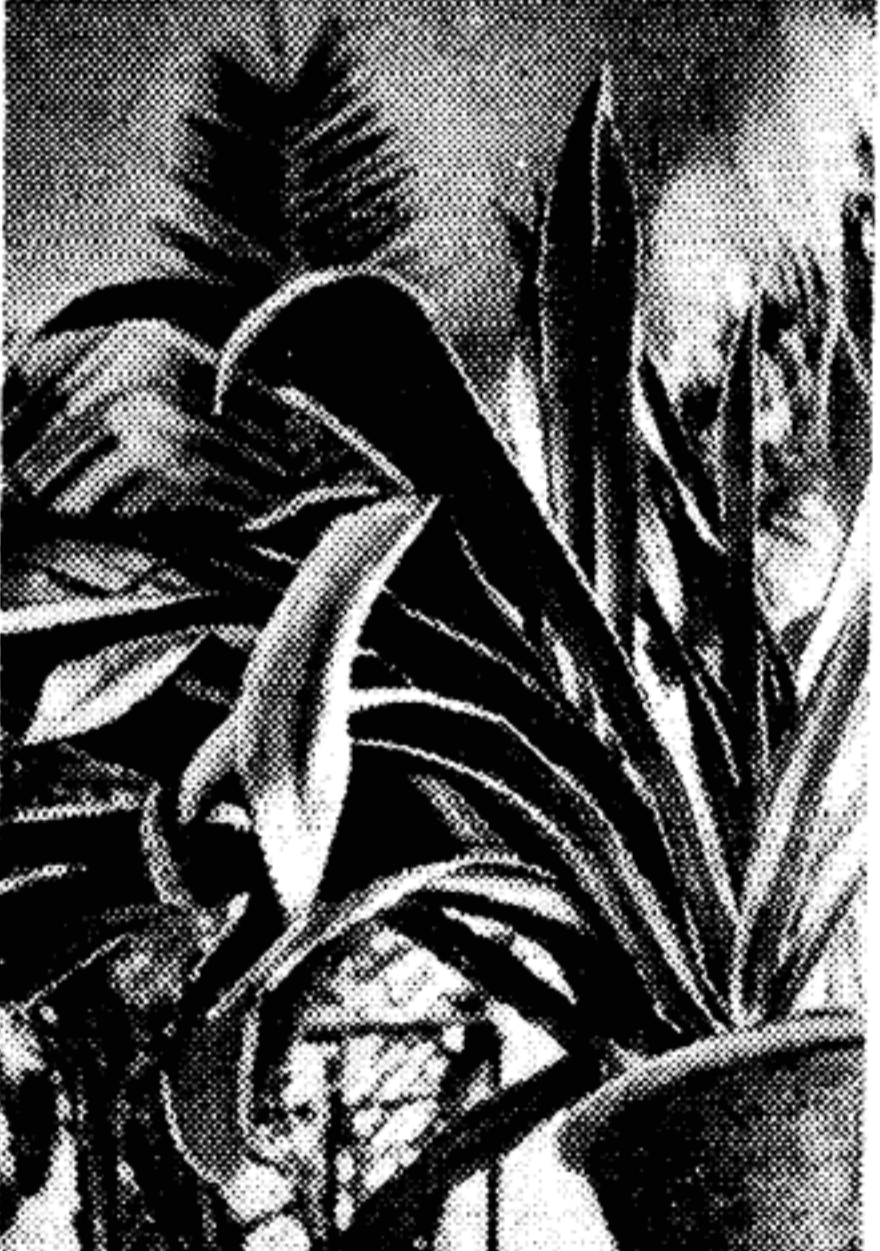
В тундрах Амазонии

Недавно мне довелось побывать с делегацией на Луне. Луна — это планета контрастов. С одной стороны — блестящие на Солнце раскопанные стройные кратеры, с другой — черные впадины, мрачные провалы, полуразвалившиеся лачуги ветхих горных цепей.