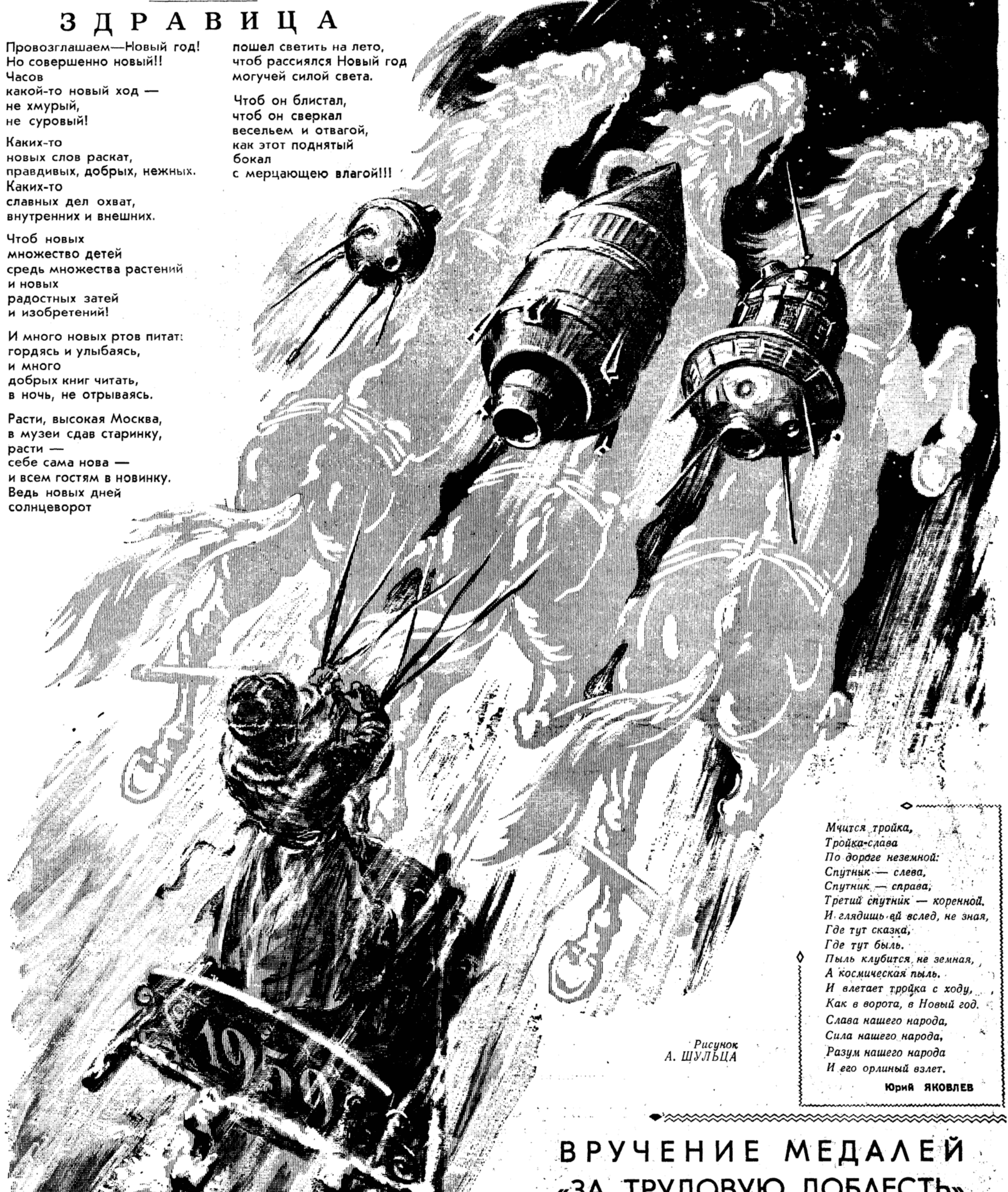
Рисунок А. ШУЛЬЦА

Мчится тройка, Тройка-слава По дороге неземной: Спутник — слева, Спутник — справа, Третий спутник — коренной. И глядишь ей вслед, не зная, Где тут сказка, Где тут был. Пыль клубится не земная, А космическая пыль, И влетает тройка с ходу, Как в ворота, в Новый год. Слава нашего народа, Сила нашего народа, Разум нашего народа И его орлиный взлет. Юрий ЯКОВЛЕВ